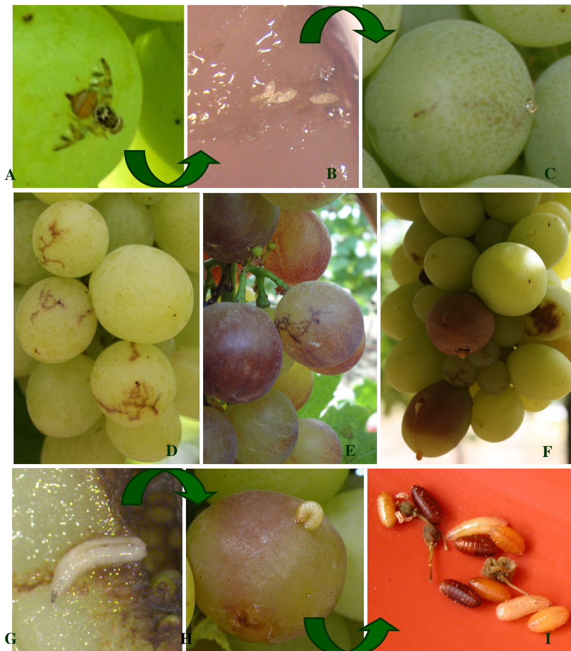
Fig. 1 - Ciclo de vida da mosca do Mediterrâneo: Adulto (A); Postura de ovos no interior do bago (B); Eclosão das larvas e exibição dos sinais da infestação (C, D, E e F); Larva alimentando-se no interior do bago (G); Larva a sair para o exterior (H); Transformação das larvas em pupas (I).

A atividade deste inseto provoca estragos diretos (picadas na superfície dos bagos e destruição da polpa decorrente da alimentação das larvas) e indiretos (a partir das lesões provocadas pela praga, desenvolvem-se fungos saprófitas, bactérias e outros insetos, o que agrava os estragos nos cachos) (Fig. 1).