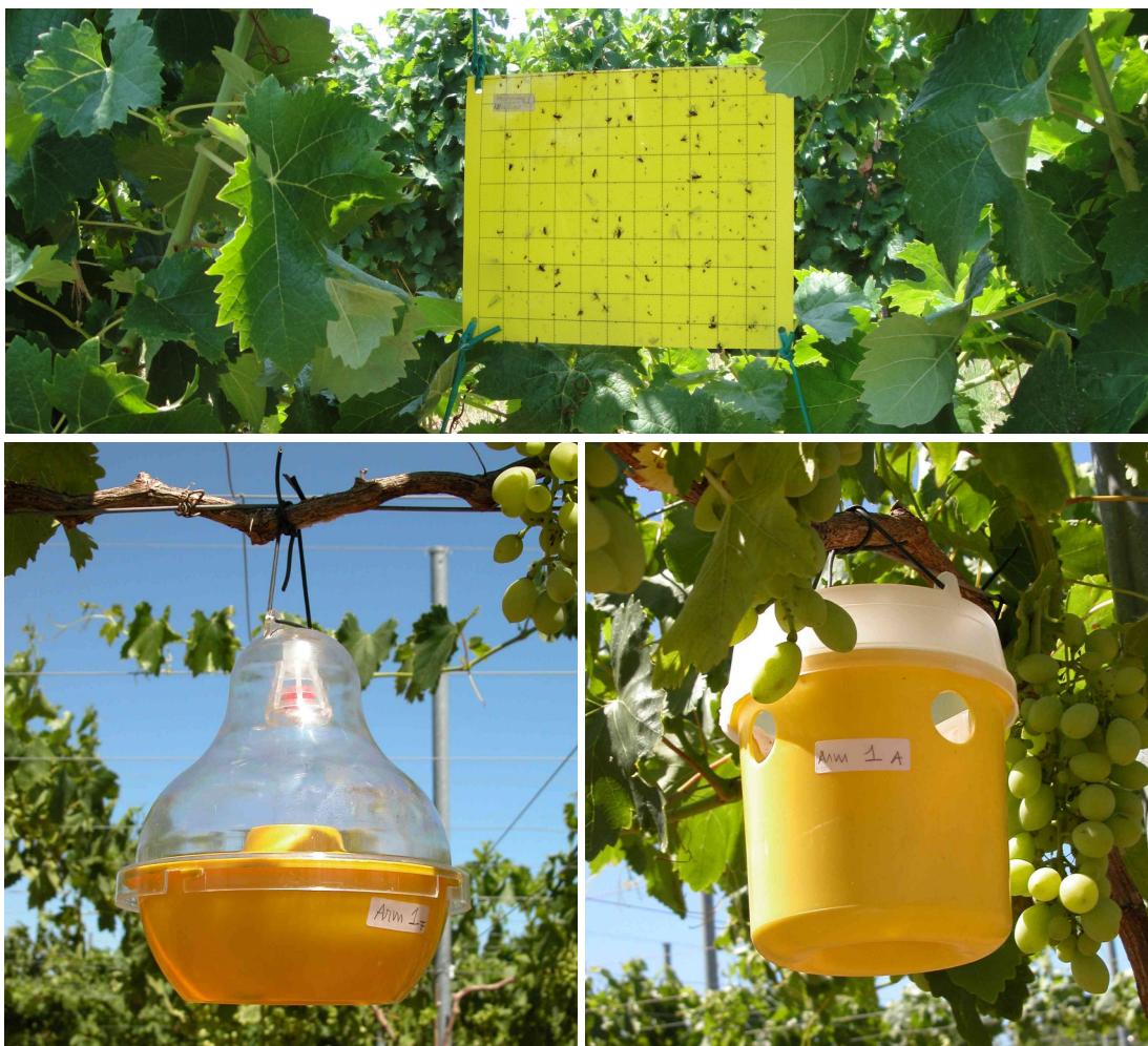
Fig. 3 - Exemplos de armadilhas utilizadas na monitorização da mosca do Mediterrâneo. Placa cromotrópica (A); Garrafa mosqueira tipo “Dome” (B); Copos mosqueiros tipo “Tephri”(C).

Segundo orientações elaboradas pela Direção-Geral de Alimentação e Veterinária (DGAV), a estimativa do risco realiza-se partir do início do crescimento dos bagos, de acordo com a metodologia apresentada no Quadro 1.