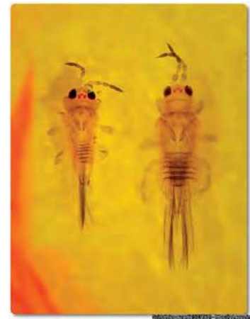
Foto 1 – Macho e fêmea do Scirtothrips aurantii numa placa amarela

As fêmeas possuem coloração amarela pálida a alaranjado, antenas com 8 segmentos, e bandas escuras acastanhadas nos segmentos abdominais e medem cerca de 0.6-1.1 mm de comprimento. As fêmeas da S. aurantii inserem os seus ovos nas folhas jovens, ramos e frutos utilizando o seu ovipositor em forma de serra. Os machos são similares às fêmeas (Foto 1), mas mais pequenos com um comprimento de cerca de 0.8 mm. Os machos desta espécie diferenciam-se de outros por terem um tergito abdominal IX um par largo e escuro de processos laterais e pela presença de uma fila de 6 setas fortes na margem superior do fémur das patas traseiras (Ficha divulgativa, 2022).