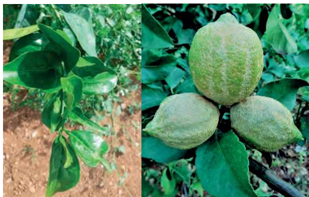
Fotos 2 e 3: Estragos nas folhas e frutos causados pela Scirtothrips aurantii Faure.

ções mais ou menos pronunciadas com espessamento linear da lamina foliar que passa a cor acastanhada e pode originar a queda de folhas prematura. Na base do fruto gera uma cicatriz superficial, formando um anel à volta do pedúnculo que aumentam com o crescimento do fruto (MacLeod e Collins, 2006; EFSA PLH Panel, 2018) (Foto 3). Folhas com estes sintomas também podem conter pequenos pontos pretos. Um ataque severo em folhas novas pode reduzir substancialmente a produção do ano seguinte (Kamburov, 1991). As variedades Navel são consideradas as mais suscetíveis a S. aurantii (Gilbert e Bedford, 1998).