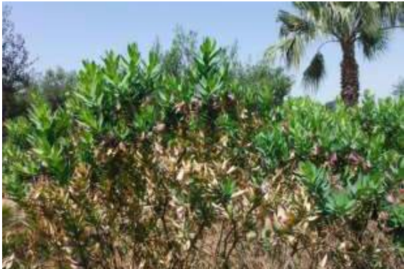
Imagem 14: Sintomas em Polygala myrtifolia - Donato Boscia CNR Bari