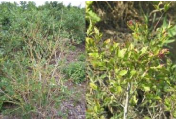
Imagem 17: Sintomas em Mirtilo.