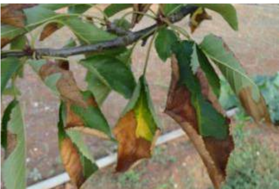
Imagem 13: Prunus avium - Donato Boscia CNR Bari