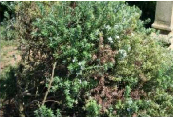
Imagem 9: Westringia fruticosa - Donato Boscia CNR Bari