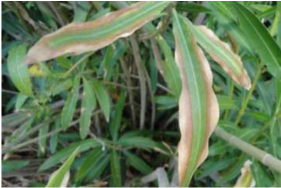
Imagem 8: Nerium oleander - Donato Boscia CNR Bari