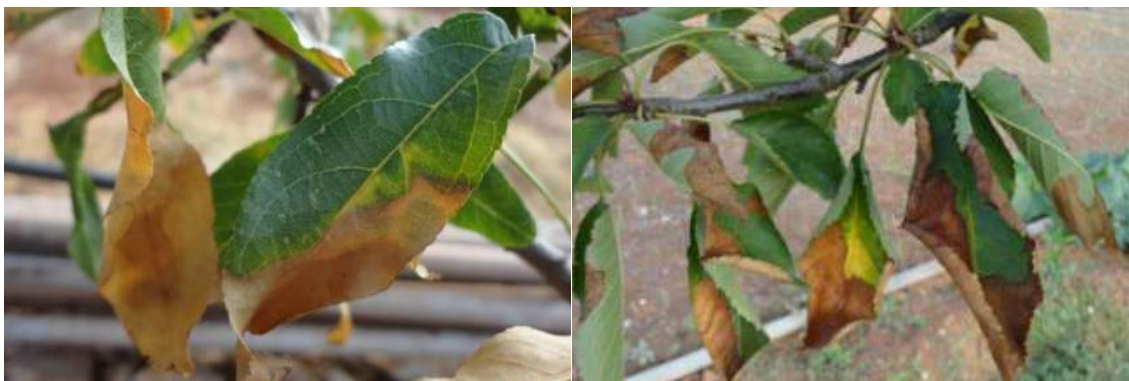
Imagem 20: Sintomas em Quercus rubra (*)