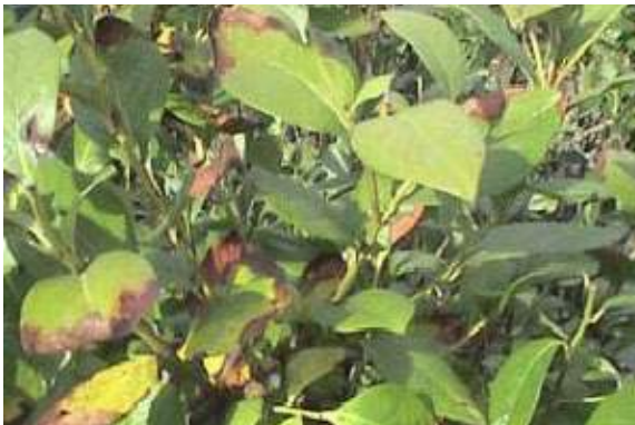
Imagem 16: Sintomas em Mirtilo.