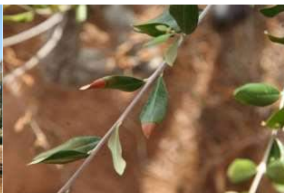
Imagem 7: Sintomas em folhas de oliveira - Donato Boscia CNR Bari