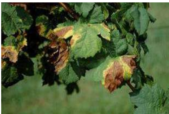
Imagem 4: Necrose marginal provocado por X. fastidiosa em folhas de videira. EPPO

Pessegueiros: ramos com entrenós mais curtos, comprimento dos pecíolos e da área foliar também menores e, num estágio mais avançado da infeção, ocorre senescência das folhas mais maduras, ficando o ramo desprovido de folhas ou com pequeno número de folhas no seu ápice - Phony Peach Disease (PPD).