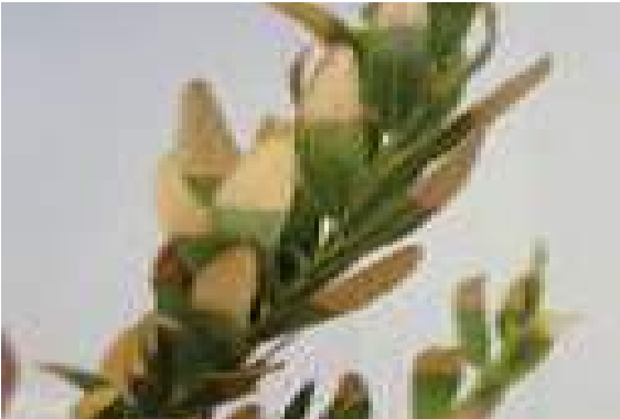
Imagem 15: Sintomas em Polygala myrtifolia