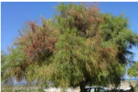
Imagem 18: Sintomas em Acacia saligna - Donato Boscia CNR Bari