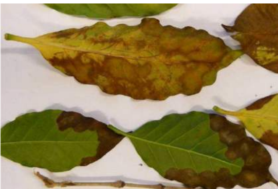
Imagem 19: Sintomas em cafeeiro (Coffee Leaf Scorch-CLS). NPPO, NL