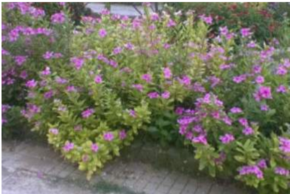
Imagem 10: Vinca sp - Donato Boscia CNR Bari