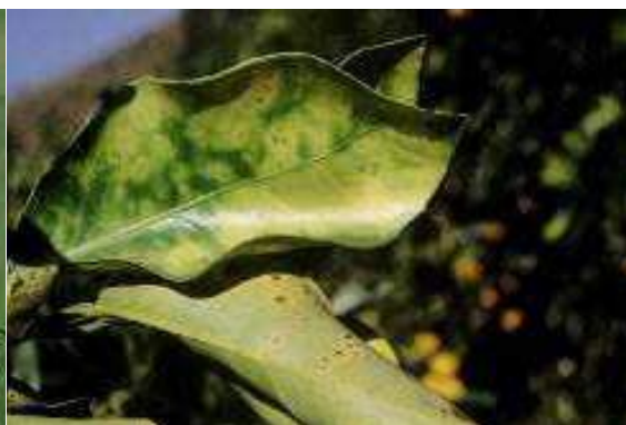
Imagem 5: Marmoreado da Clorose variegada dos citrinos. EPPO