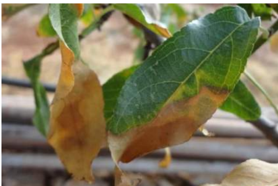
Imagem 12: Prunus dulcis - Donato Boscia CNR Bari