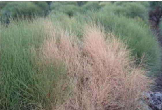
Imagem 11: Spartium junceum - Donato Boscia CNR Bari