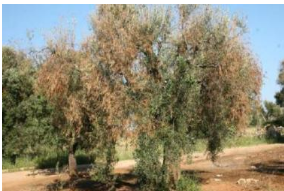
Imagem 6: Ramos e folhas secas em oliveiras em Itália. EPPO