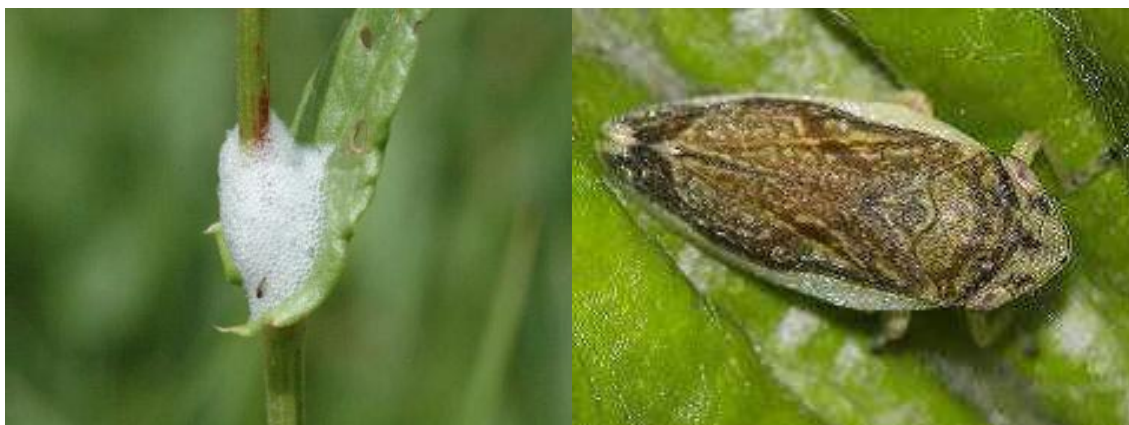
Imagem 3: Vetor de X. fastidiosa na Europa - Philaenus spumarius (Aphrophoridae) Russell F. Mizell, Peter C. Andersen, Christopher Tipping, Brent Brodbeck (University of Florida)

A principal via de dispersão da bactéria a longas distâncias é o comércio de plantas contaminadas. Insetos vetores infetados, transportados em material vegetal, constituem também uma via potencial de entrada da bactéria. A bactéria é ainda transmissível por enxertia entre partes de plantas contaminadas. Outros materiais vegetais (madeira, flores de corte, frutas, folhagem ornamental) são considerados de baixo risco de transmissão da bactéria.