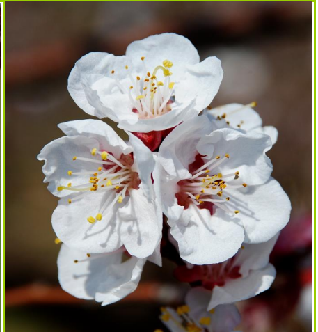
F - Flor aberta (plena floração)