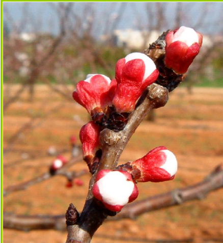
D - Aparecimento das pétalas