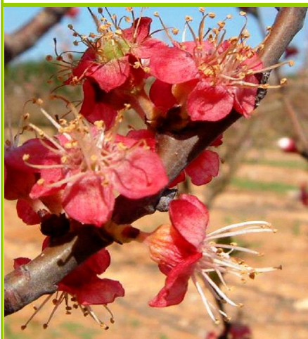
G - Queda das pétalas