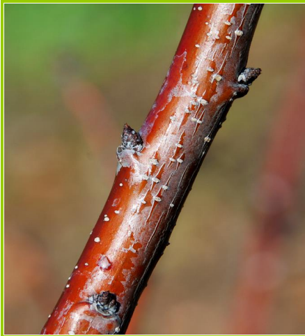
A - Botão fechado de Inverno