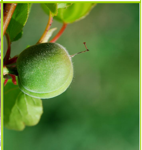
J - Fruto em crescimento