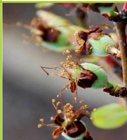
H - Fruto vingado