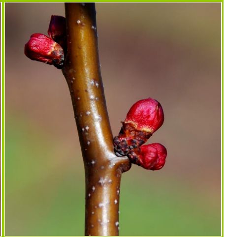
C - Aparecimento do cálice