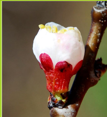
E - Aparecimento dos estames