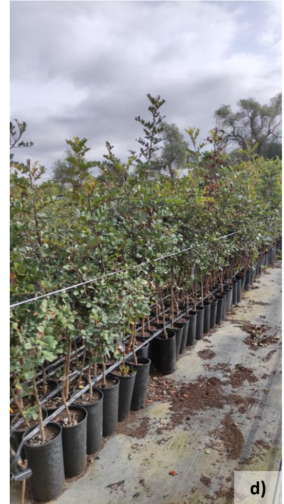
Fases de desenvolvimento do porta enxerto desde a sementeira até ao envasamento.