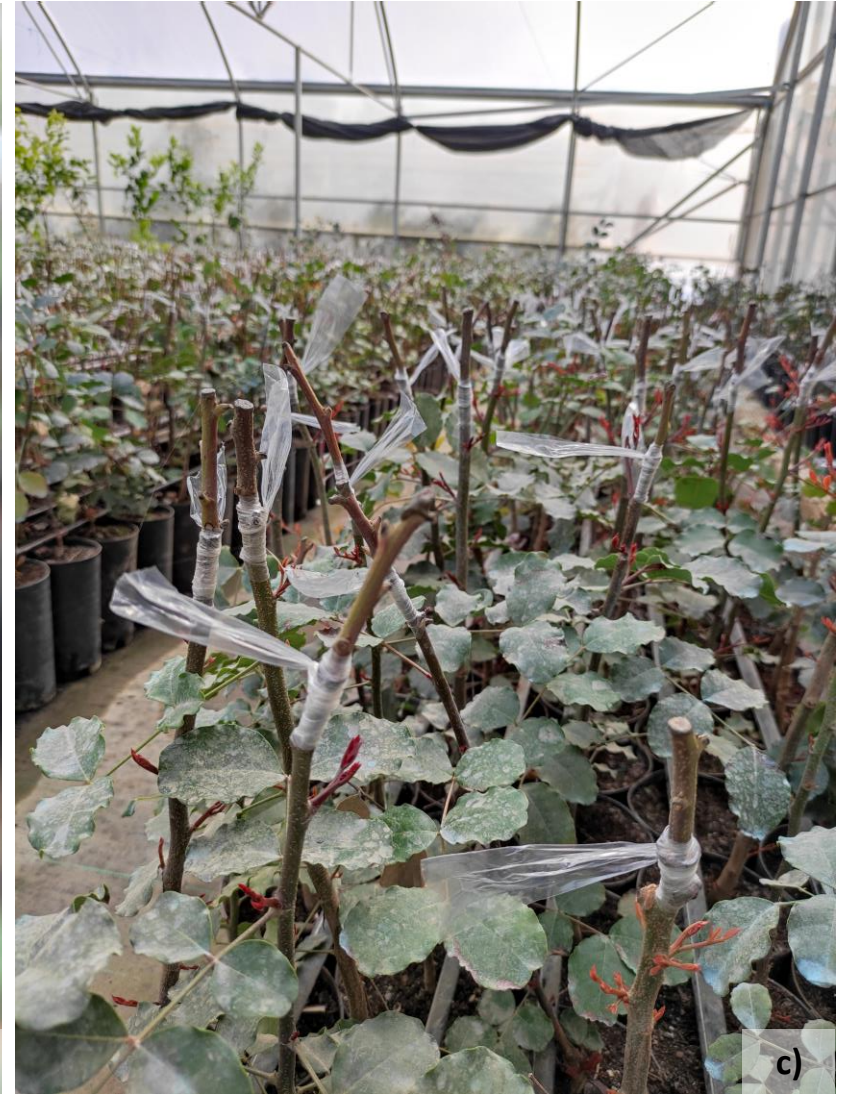
Enxertia por chapa (a), por borbulha (b) e por garfo (c).