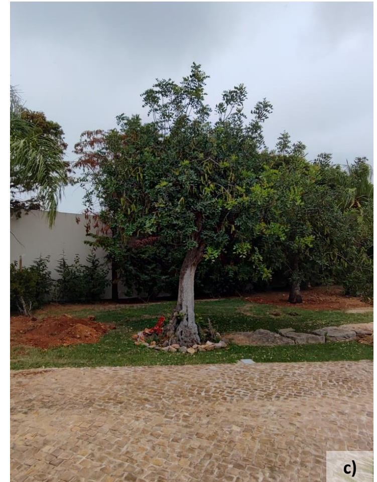
Alfarrobeira na Serra do Caldeirão (a), num pomar regado em Cacela Velha (b), e num jardim em Almancil (c).